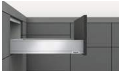
Schubkasten Zargenhöhe M (90.5 mm)

* Außer Edelstahl (Inox) Antifingerprint