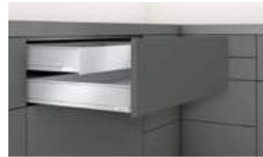
Innenschubkasten Zargenhöhe M (90.5 mm)

Nennlängen 270 mm 300 mm 350 mm 400 mm 450 mm 500 mm 550 mm 600 mm 650 mm