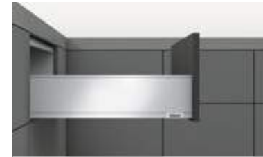
Schubkasten Zargenhöhe K (128.5 mm)

Nennlängen 300 mm* 350 mm 400 mm 450 mm 500 mm 550 mm 600 mm*