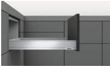
Schubkasten Zargenhöhe N (66.5 mm)

Nennlängen 400 mm* 450 mm 500 mm 550 mm*