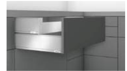
Innenschubkasten Zargenhöhe K (128.5 mm)

* Außer Edelstahl (Inox) Antifingerprint